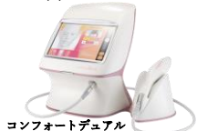
コンフォートデュアル