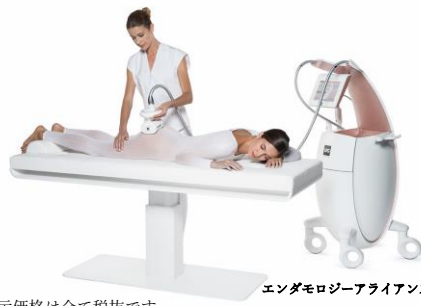
表示価格は全て税抜です